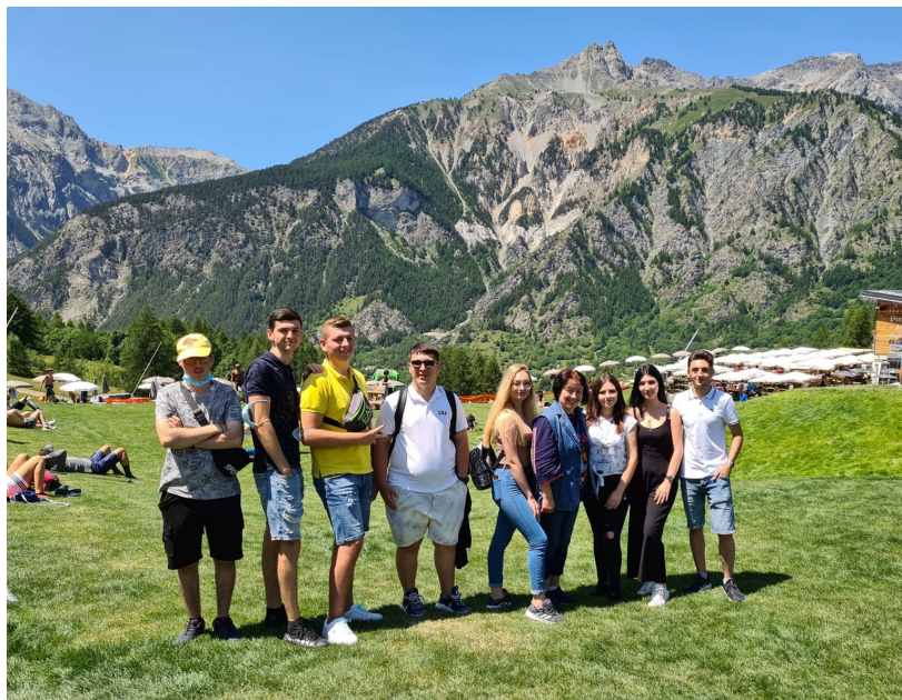
Vizitarea localitatii Baldonecchia, Piemont