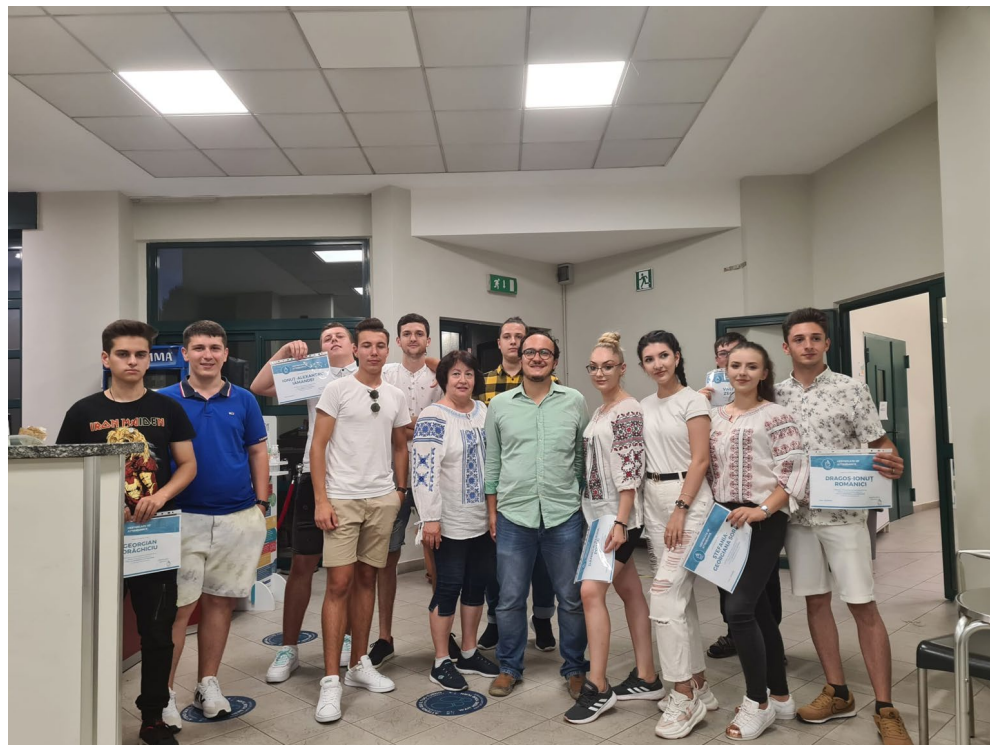
Primirea diplomelor oferite de programul Erasmus+ prin tutorele de practica