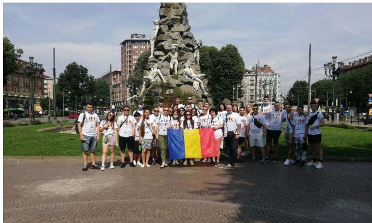
Vizitarea orasului alaturi de ghid

NOI COMPETENȚE – TRANZIȚIE SPRE PIAȚA MUNCII 2019-1-RO01-KA102-061868